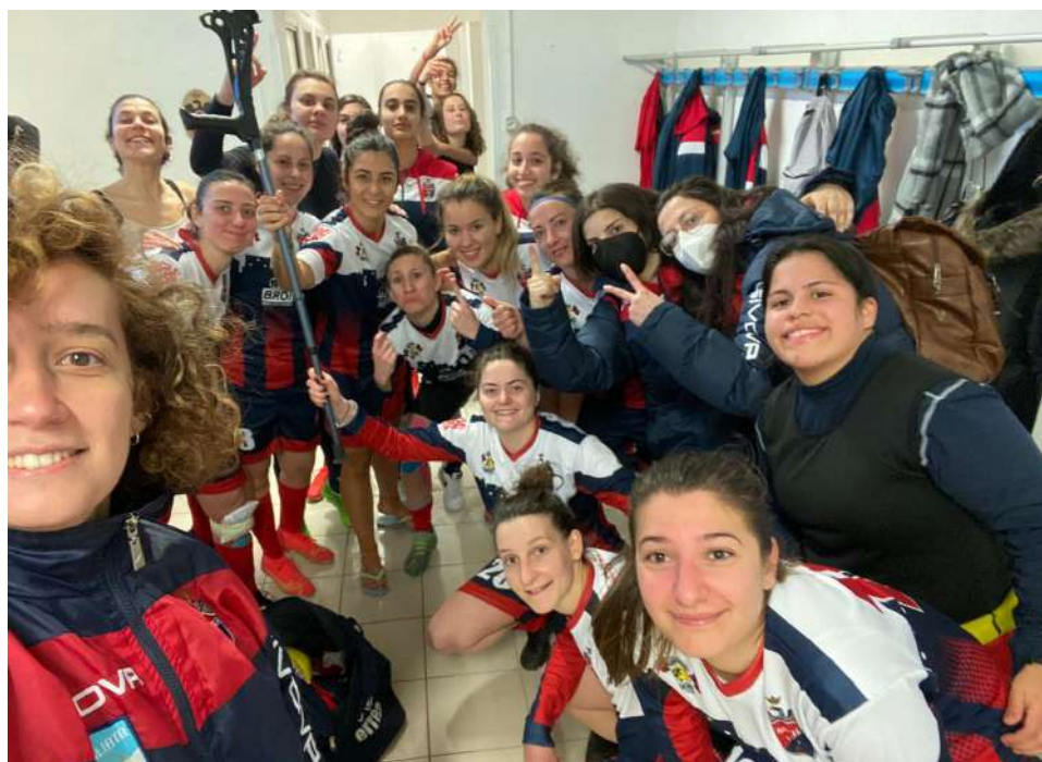
in foto: Il selfie della Femminile dopo il successo nel derby

Bilancio positivo per gli eSports, con l'Academy L'Aquila Calcio che si è portata al quinto posto in classifica, grazie alle preziose vittorie conquistate contro Il Delfino Curi Pescara (1-2) e Lettese (3-1).